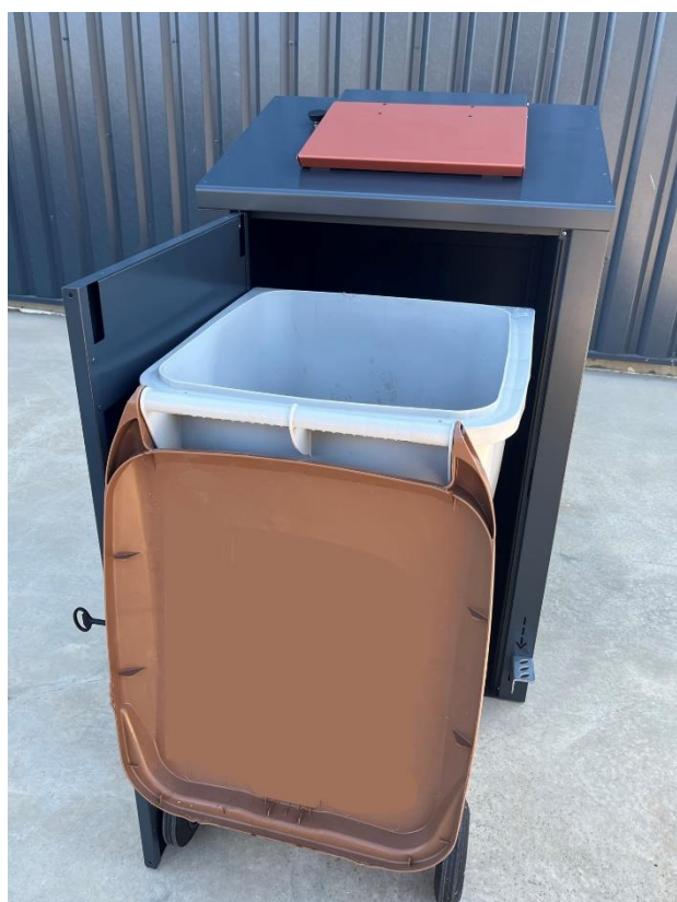
Ouverture porte avant