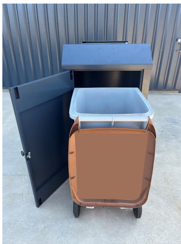
Ouverture porte arrière