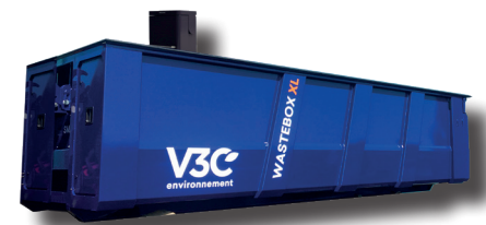
Fabriqué en Bretagne